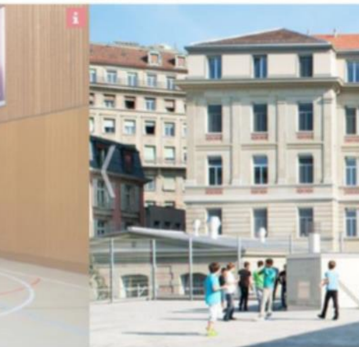
EPS de Villamont